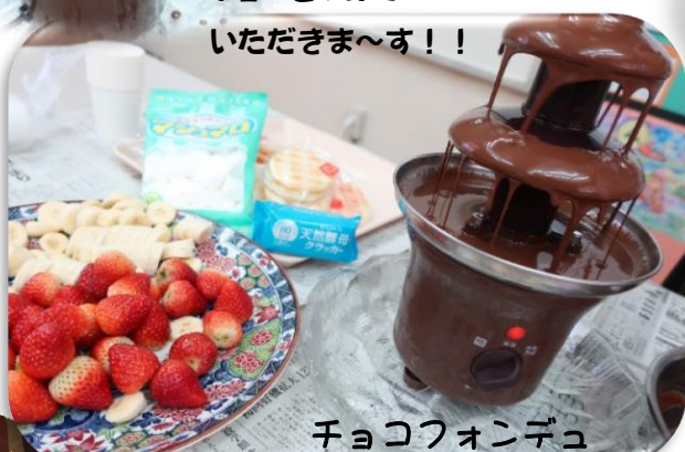
チョコフォンデュ