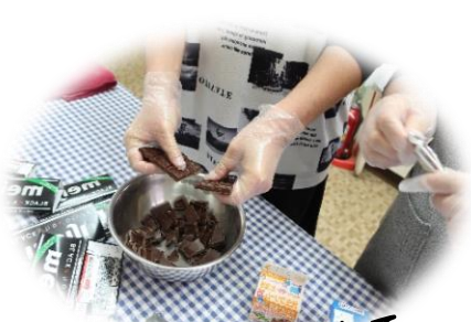
みんなでチョコを割って