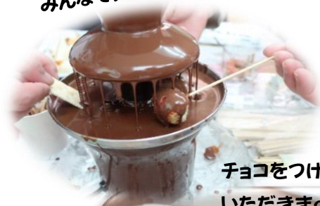
チョコをつけて いただきまへす!!