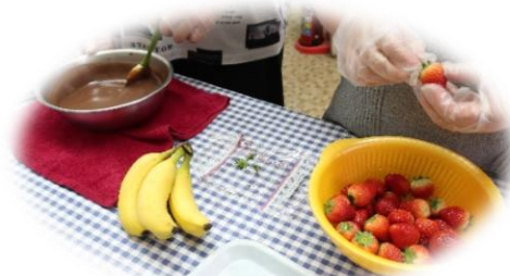
イチゴ美味しそう♪