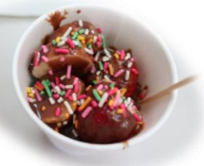
デコレーションして かわいく☆